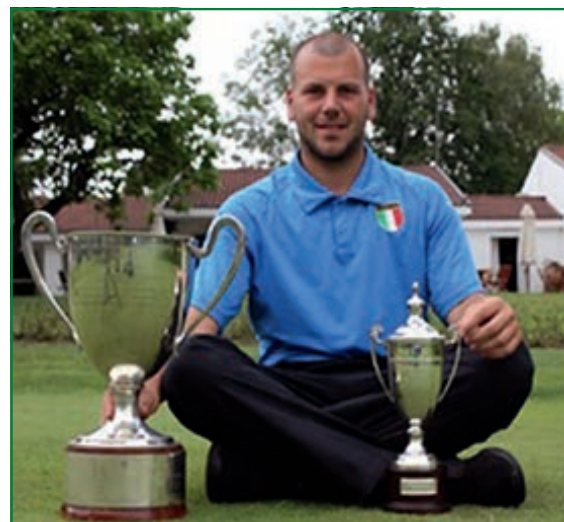
Comitato Regionale FIG